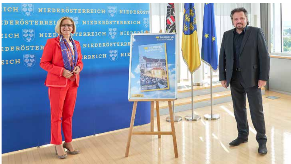
Die Sommerbühnen in Niederösterreich spielen wieder – und blicken voll Vorfreude Richtung Festspielsaison. Von 13. Juni bis 11. September planen die heuer 18 Spielorte des Theaterfestes Niederösterreich 22 Produktionen in bester Festspiel-Vielfalt.